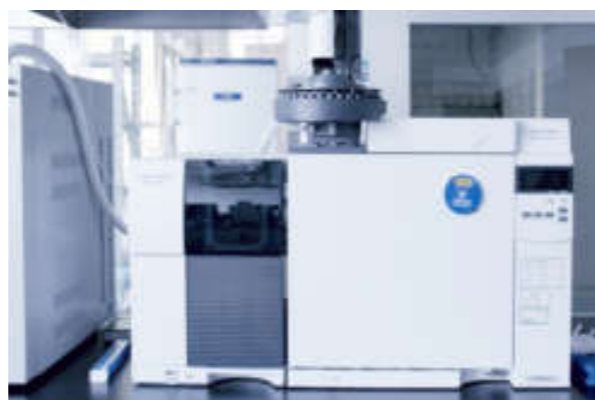
● 气相色谱-质谱仪 (7820A-5977B)