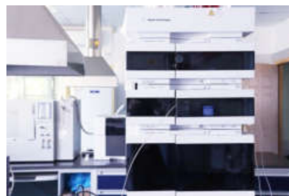
● 高效液相色谱仪 (1260)