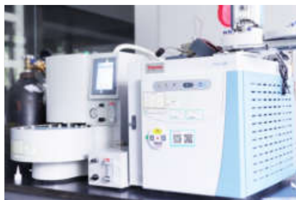
● 气相色谱仪 (trace1300)