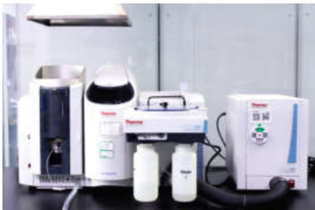
● 石墨炉火焰原子吸收光谱仪 (ICE3500)