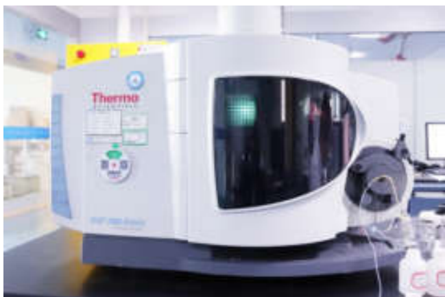
● 电感耦合等离子发射光谱仪 (Thermo ICP 7200)

准诺检测经过多次资质认定评审，获取了5个大类12产品类别1100个参数的检测资格。能为客户提供多方位检测技术服务。