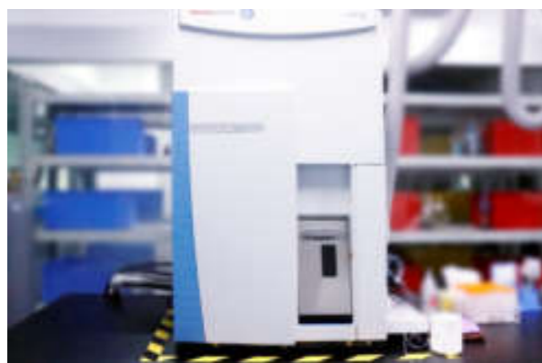
● 电感耦合等离子体质谱联用仪 (iCAP RQ)